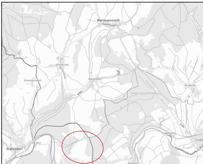
Abb. Übersicht: Lage des Vorhabens

Der Geltungsbereich liegt im südwestlichen Gemeindegebiet von Wartmannsroth (Landkreis Bad Kissingen, Regierungsbezirk Unterfranken). Der Geltungsbereich umfasst 22,3 ha. und beinhaltet die Fläche der Fl.Nr. 851 in der Gemarkung Waizenbach. Dieser Bereich soll als Sondergebiet ausgewiesen werden. Die Lage und Abgrenzung sind aus dem nachfolgenden Kartenausschnitt ersichtlich (maßstabslos).